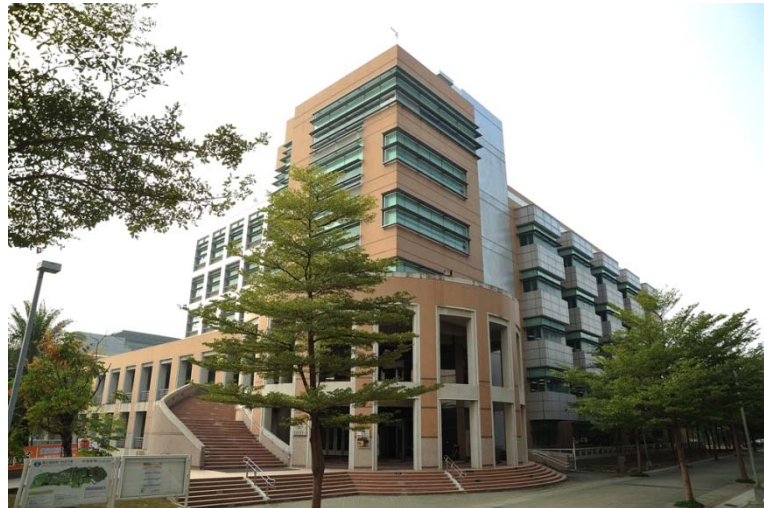
圖 1 2012 南台灣財金學術聯盟年會暨學術論文研討會地點，位於高雄第一科技大學圖書資訊館六樓。