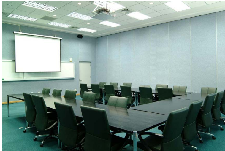
圖 3 圖書資訊館六樓分組討論室位於圖書資訊館 608-611 室，提供各論文分組研討。