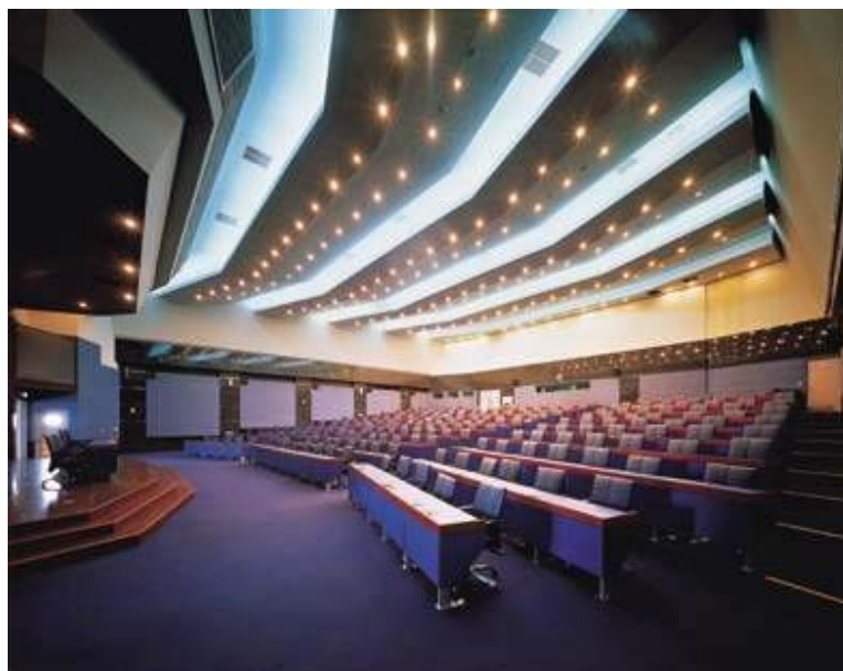
圖 2 圖書資訊館六樓 612 室國際會議廳，提供南台灣財金學術聯盟年會暨學術研討會之開幕典禮與舉行專題演講，該場地可容納 246 人。